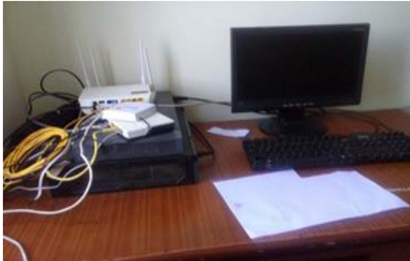
Peralatan Administrator Data Base Sihobas. Online dan Penguat Jaringan Internet

masyarakat melalui layanan Sihobas. Online dirasa cukup memadai, walaupun masih memiliki kekurangan pada peralatan pengamanan data yang dimiliki dan juga jaringan internet yang kurang stabil dan untuk peralatan yang digunakan tidak berbeda dengan peralatan SIAK (Sistem Informasi Administrasi Kependudukan) yang sebelumnya, sedikit yang membedakannya hanyalah adanya tambahan alat untuk memperkuat jaringan internet agar jaringan internet lebih stabil. Berikut ini adalah salah satu gambar sarana prasarana sihobas. online.