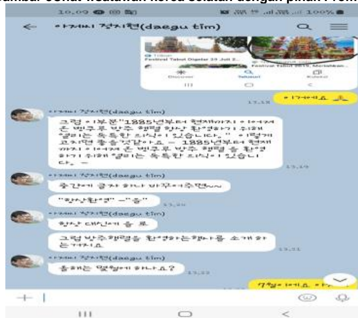
Gambar 8Chat wsatawan korea selatan dengan pihak Promosi

“죽으면넋가에묻어다요.2024언덕에묻지말고.사실엄마는 언덕에묻히기를편할날이없었지요.왜냐하면큰아들은우산장수였고작은아들은부채장수였기”