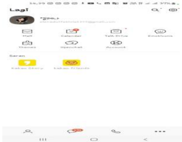
Gambar 2 Fitur Aplikasi Kakaotalk

Dinas Pariwisata Provinsi Bengkulu menggunakan fitur chat kakaotalk untuk berkomunikasi dengan calon wisatawan Korea Selatan yang ingin menanyakan atau berkomunikasi mengenai destinasi wisata sejarah yang ada di Provinsi Bengkulu, yang dimana aplikasi kakaotalk ini dipercaya sebagai media pesan terbaik di Korea Selatan.