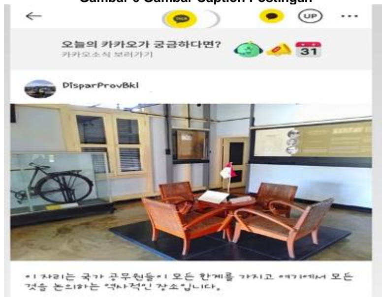
Gambar 6 Gambar Caption Postingan

Postingan seperti gambar diatas di nilai dapat membuat Wisatawan Menjadi penasaran dengan keseluruhan sejarah yang ada di Provinsi Bengkulu, dan itu benar adanya ketika peneliti mewawancarai salah satu calon wisatawan dari Korea Selatan.