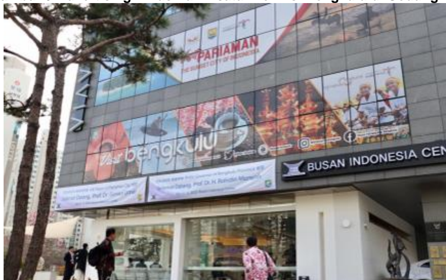
Gambar 5 Advertising Dinas Pariwisata Provinsi Bengkulu di Gedung BIC

Hasil dari sebuah kerjasama yang dilakukan pihak dinas pariwisata dengan pihak korea selatan ini menimbulkan kredibilitas yang kuat akan komunikasi yang akan berkelanjutan mengenai Pariwisata Provinsi Bengkulu.