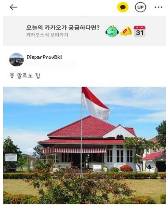
Gambar 4. Postingan Wisata Provinsi Bengkulu di Fitur Kakaotalk

Kakaotalk sangat berperan penting sebagai media dalam Promosi Potensi Pariwisata Provinsi Bengkulu kepada Wisatawan Korea Selatan, yang dimana semua penduduk Korea Selatan adalah Pengguna kakaotalk aktif dan sangat memungkinkan untuk berhubungan melalui media kakaotalk dalam mempromosikan Pariwisata Bengkulu kepada wisatawan Korea Selatan. Pentingnya promosi wisata sejarah di fitur chat kakaotalk adalah meningkatkan minat orang Korea Selatan untuk berkunjung ke Provinsi Bengkulu dan dapat meningkatkan pendapatan pariwisata Provinsi Bengkulu, dimana diharapkan pengembangan wisata di Provinsi Bengkulu lebih maju lagi.