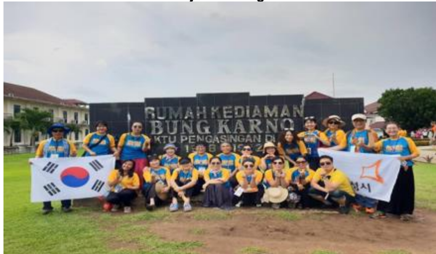
Gambar 7 Dokumentasi Penerjemah Dengan Wisatawan Korea Selatan

Tempat yang di datangi berkewajiban melayani sesuai dengan aturan dan prosedur yang berlaku seperti contohnya dalam sebuah bahaasa, dimana kita yang berasal dari kota yang di kunjungi wajib