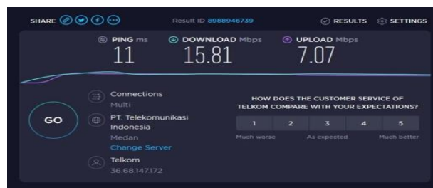
Gambar 4. Hasil Pengukuran Throughput dengan Speedtest.cbo.net.id