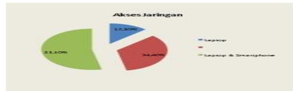
Gambar 2 Karakteristik Responden Berdasarkan Akses Jaringan

Berdasarkan temuan analisis data yang digambarkan pada grafik di atas, terlihat bahwa di antara seluruh responden, total 4 orang, yang merupakan 12,50% sampel, menggunakan laptop sebagai perangkat komputasi utama mereka. Selain itu, 11 peserta, yang merupakan 34,40% sampel, menggunakan ponsel pintar sebagai perangkat teknologi pilihan mereka. Selain itu, perlu dicatat bahwa mayoritas dari 17 responden, setara dengan 53,10% sampel, menggunakan laptop dan ponsel pintar secara bersamaan.