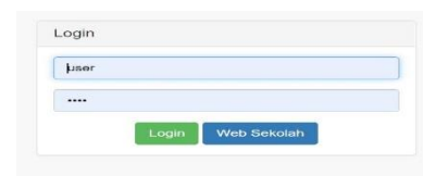
Gambar 4.2: Halaman Login

Pada sub menu ini, peneliti membuat rancangan dari halaman mata pelajaran, siswa, guru, pengumuman, berita, gallery, kurikulum, setting, dan login out.