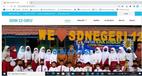
Gambar 4.3: Halaman Home

Adapun tampilan website utama ketika pengunjung pertama kali mengakses alamat website dengan alamat link: https://sdn12oku.sch.id . Terdapat slide yang memberikan kesan user friendly . Halaman home berisi slide berita dan berita terbaru.