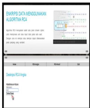
Gambar 4 Tampilan Halaman Deskripsi RC4 Angka

Tampilan Halaman Deskripsi RC4 Angka: Halaman ini digunakan untuk mendeskripsi data angka dengan memasukkan kata kunci pada saat enkripsi data sebelumnya. Tampilan halaman deskripsi data angka dapat dilihat pada Gambar 4.