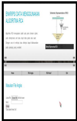
Gambar 2 Tampilan Halaman Open File Angka