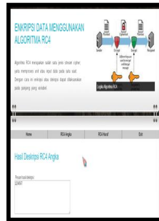
Gambar 5. Tampilan Halaman Hasil Deskripsi RC4 Angka

Adapun tampilan halaman open file huruf dapat dilihat pada Gambar 6.