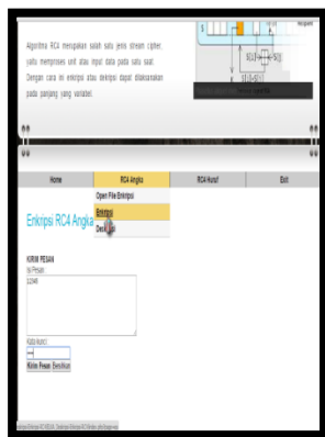
Gambar 3. Tampilan Halaman Enkripsi RC4 Angka

Tampilan Halaman Deskripsi RC4 Angka: Halaman ini digunakan untuk mendeskripsi data angka dengan memasukkan kata kunci pada saat enkripsi data sebelumnya. Tampilan halaman deskripsi data angka dapat dilihat pada Gambar 4.