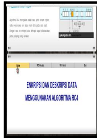
Gambar 1 Tampilan Halaman Home

Tampilan Halaman Home: Halaman ini merupakan tampilan awal sistem. Pada halaman ini disediakan informasi mengenai algoritma RC 4. Adapun tampilan halaman home dapat dilihat pada Gambar 1.