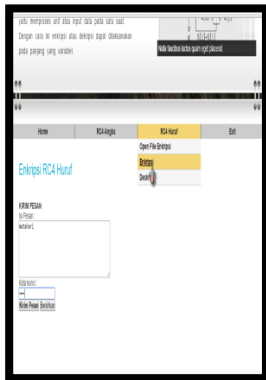
Gambar 8. Tampilan Halaman Deskripsi RC4 huruf

Tampilan Halaman Deskripsi RC4 Huruf: Halaman ini digunakan untuk mendeskripsi data huruf dengan memasukkan kata kunci pada saat enkripsi data sebelumnya. Tampilan halaman deskripsi data huruf dapat dilihat pada Gambar 8.