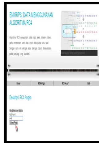
Gambar 6. Tampilan Halaman Open File RC4 Huruf

Tampilan Halaman Enkripsi RC4 Huruf: Halaman ini digunakan untuk mengenkripsi data huruf dengan memasukkan huruf yang akan dienkripsi ke dalam kotak kosong yang telah disediakan, kemudian masukkan kunci enkripsi minimal 5 karakter. Setelah itu klik “ irim ”. Tampilan halaman enkripsi huruf dapat dilihat pada Gambar 7.