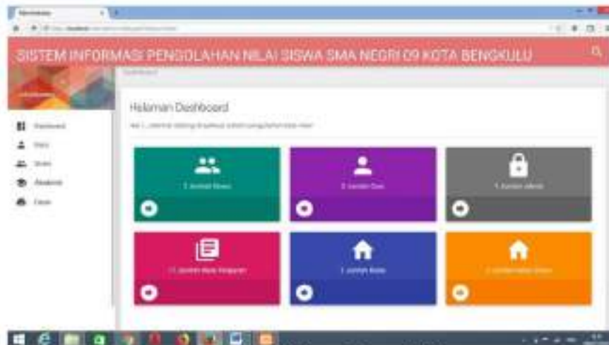
Gambar 3 Halaman Utama Admin

Menu utama admin berisi tampilan serta perintah untuk menjalankan aplikasi dalam mengoperasikan aplikasi bagian sistem informasi pengolahan nilai pada SMA 9 Kota Bengkulu.