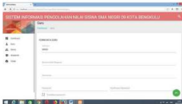
Gambar 4. Menu Input Data Guru

Form Input data guru digunakan untuk memasukkan data-data guru yang berisikan tentang biodata guru apabila data guru tersebut telah di input maka data guru tersebut akan ditampilkan seperti gambar dibawah: