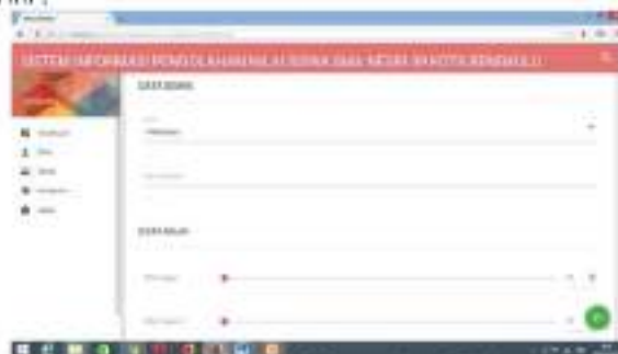
Gambar 16 Menu input Nilai

Form input data nilai digunakan untuk memasukan data-data nilai siswa. Adapun gambar dapat dilihat dibawah ini :