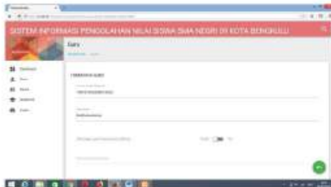
Gambar 6 Form Edit Data Guru

Form edit digunakan untuk mengubah data guru apabila mengalami perubahan.