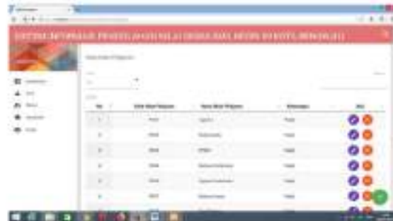
Gambar 11 Menu Data Mapel

Form menu data mata pelajaran digunakan untuk menampilkan data-data mata pelajaran yang telah di inputkan sebelumnya. Setelah data di input admin dapat merubah data tersebut dengan menggunakan 2 tombol aksi yaitu detail digunakan untuk mengedit dan menghapus data siswa jika mengalami perubahan. Untuk lebih jelasnya dapat dilihat pada gambar dibawah ini :