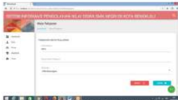
Gambar 10 Menu Input Data Mapel

Form input data mata pelajaran digunakan untuk memasukan data-data pelajaran. Untuk lebih jelasnya lihat gambar dibawah ini :