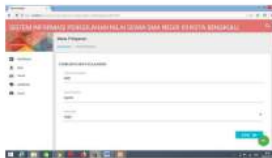
Gambar 12 Menu Edit Data Mapel

Form edit digunakan untuk mengubah data mata pelajaran yang telah di input sebelumnya apabila mengalami perubahan. Untuk lebih jelas lihat gambar dibawah: