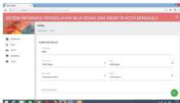
Gambar 13 Menu Input Data Kelas

Form input data kelas digunakan untuk memasukan data-data kelas siswa yang berkaitan tentang ruang belajar siswa. Adapun gambar dapat dilihat dibawah ini :