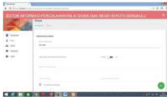
Gambar 9 Menu Edit Data Siswa

Form menu edit digunakan untuk mengubah data mahasiswa apabila mengalami perubahan.