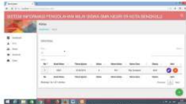
Gambar 14 Menu Data Kelas

Menu data kelas digunakan untuk melihat data ruang belajar siswa. Jika data kelas telah di input maka data tersebut akan ditampilkan. Pada menu ini juga terdapat tombol aksi yang digunakan untuk mengedit atau menghapus data. Tampilan dapat dilihat pada gambar dibawah ini :