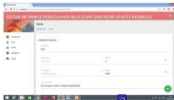
Gambar 15 Menu Edit Data Kelas

Form edit data kelas dapat digunakan untuk mengedit data-data yang telah di inputkan sebelumnya apabila mengalami perubahan. Form edit data kelas dapat di lihat pada gambar dibawah ini :