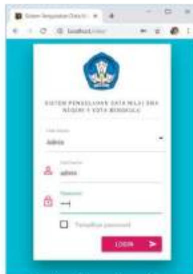
Gambar 2 Form Menu Login

Menu Login ini digunakan agar pengguna dapat masuk dan mengakses accountrnya setelah dilakukan validasi yang biasanya berupa username dan password.