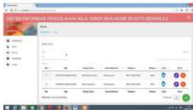
Gambar 5 Tampilan Menu Data Guru