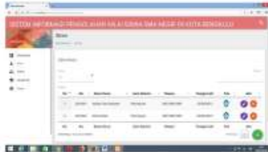
Gambar 8 Menu Data Siswa

Form menu data siswa digunakan untuk menampilkan data-data siswa yang telah di inputkan sebelumnya. Setelah data siswa di input admin dapat merubah data tersebut dengan menggunakan 2 tombol aksi yaitu detail digunakan untuk mengedit dan menghapus data siswa jika mengalami perubahan. Untuk lebih jelasnya dapat dilihat pada gambar dibawah ini :