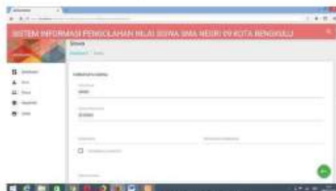
Gambar 7 Menu Input Data Siswa

Form input data siswa digunakan untuk memasukan data-data siswa yang berisikan tentang biodata siswa. Menu akan ditampilkan seperti gambar dibawah :