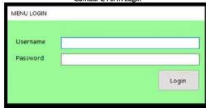
Gambar 2 Form Login

Jika memasukkan username dan password yang benar pada form login, maka akan menampilkan pesan berhasil seperti Gambar 3 Namun sebaliknya jika memasukkan username dan password yang salah pada form login, maka akan menampilkan pesan gagal seperti Gambar 3.