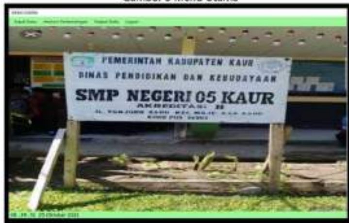
Gambar 5 Menu Utama

Merupakan menu yang memiliki sub menu untuk membantu admin dalam mengolah data pada Aplikasi pemilihan siswa berprestasi di SMP Negeri 5 Kaur Provinsi Bengkulu, yaitu input data, analisis perbandingan, output data, dan logout. Adapun form menu utama seperti Gambar 5.