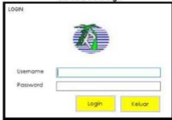
Gambar 2 Menu Login

Menu login merupakan form yang digunakan untuk membatasi akses penggunaan aplikasi melalui username dan password. Sehingga admin harus memasukkan username dan password yang benar agar dapat masuk ke menu utama agar dapat mengakses secara keseluruhan dari Aplikasi Prediksi Jumlah Hasil Produksi Kelapa Sawit di PT. Bumi Rafflesia Indah.