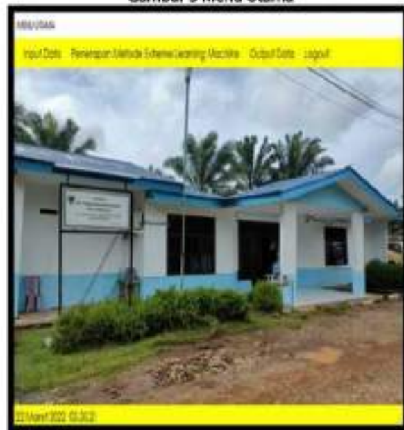
Gambar 3 Menu Utama

Menu utama merupakan form menu yang memiliki beberapa sub menu yang dapat diakses oleh admin untuk melakukan pengolahan data pada Aplikasi Prediksi Jumlah Hasil Produksi Kelapa Sawit di PT. Bumi Rafflesia Indah yang memiliki fungsi yang berbeda-beda.