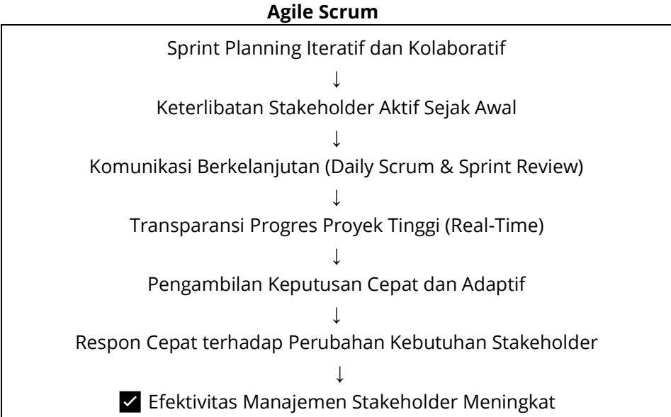
Gambar 1 Kerangka Berpikir Agile Scrum

Penerapan Sprint Planning yang bersifat kaku dan top-down menyebabkan keterlibatan stakeholder menjadi terbatas. Kondisi ini berdampak pada tidak berjalannya komunikasi proyek secara berkelanjutan, sehingga transparansi progres proyek menjadi rendah. Akibatnya, proses pengambilan keputusan cenderung lambat dan hierarkis, yang pada akhirnya menghambat respons organisasi terhadap perubahan kebutuhan dan ekspektasi stakeholder. Rangkaian kondisi tersebut berkontribusi langsung terhadap rendahnya efektivitas manajemen stakeholder dalam proyek.