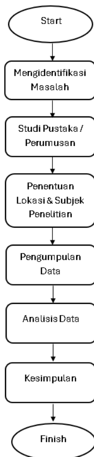
Gambar 3 Alur Penelitian