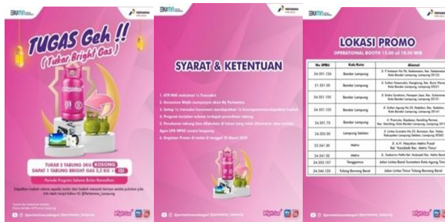
Gambar 1. Tranformasi Gas Bersubsidi Menuju Non-Subsidi

Penggunaan LPG bersubsidi di kelompok menengah keatas merupakan masalah kompleks dan mendalam yang memerlukan perhatian serius dan tindakan nyata dari berbagai pihak terkhusus pemerintah itu sendiri. Sebagai upaya untuk memerangi penyimpangan ini, perlu dilakukan langkah-langkah inovasi yang terencana dan berkelanjutan. Inovasi digunakan secara sengaja di buat untuk tujuan pengembangan dan strategi yang menarik.