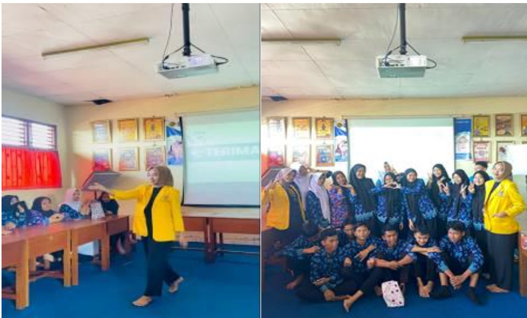
Gambar 2 Sosialisasi Kepada Siswa Siswi

Dengan mengambil langkah-langkah ini, sekolah dapat menciptakan lingkungan yang mendukung dan mendorong perkembangan jiwa kewirausahaan di antara siswa mereka, yang pada gilirannya dapat membantu meningkatkan minat dan motivasi mereka untuk mengejar peluang bisnis dan mencapai kesuksesan dalam karir mereka di masa depan.