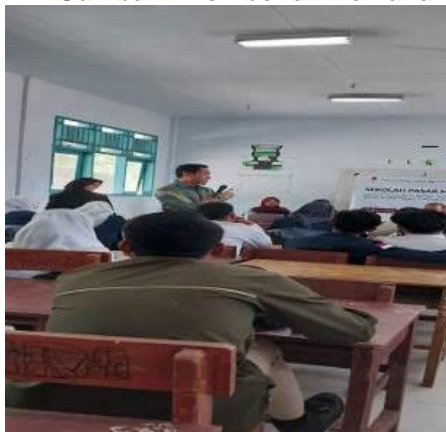
Gambar 2 Pemberian Pemahaman mengenai Pasar Modal dan Investasi

Kegiatan ini dilanjutkan dengan kegiatan diskusi interaktif antara tim pengabdian masyarakat Dosen Fakultas Ekonomi dan Bisnis Univeritas Dehasen, Perwakilan Bursa Efek Indonesia Bengkulu dengan siswa/siswi dan para guru SMKN 3 Bengkulu Tengah. Pendapmingan ini juga akan berlanjut dengan diskusi di tempat dan cara lain yakni memberikan nomor HP salah satu Tim Pengabdian Kepada Masyarakat yang dapat diakses untuk berdiskusi.