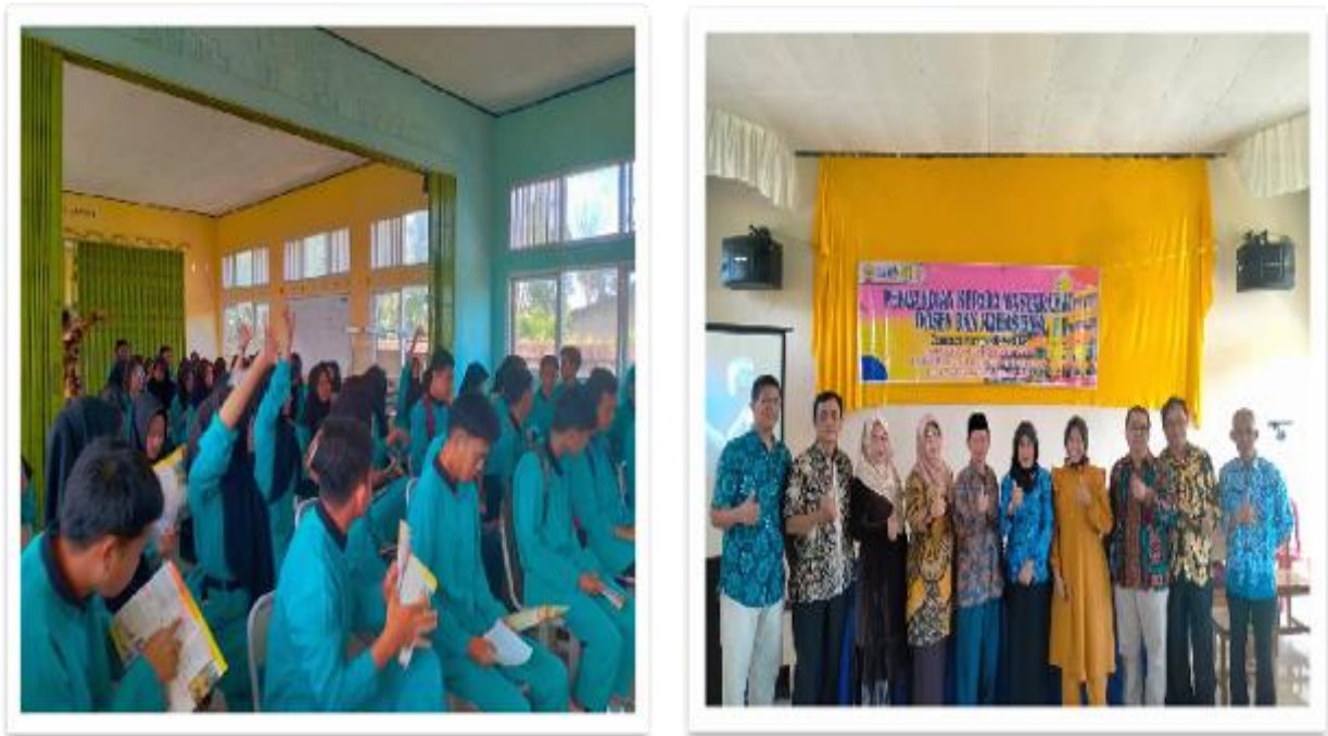
Gambar 3 Materi Persentasi Pengabdian Kepada Masyarakat