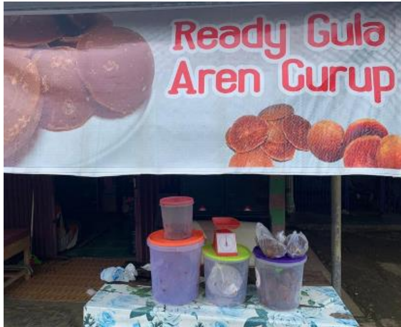
Gambar 1. Usaha UMKM Gula Aren Curup

Jadi, usaha UMKM Gula Aren Curup ini pada bulan Mei dan Juni mendapatkan laba bruto dari penjualan yaitu sebesar Rp. 522.000.