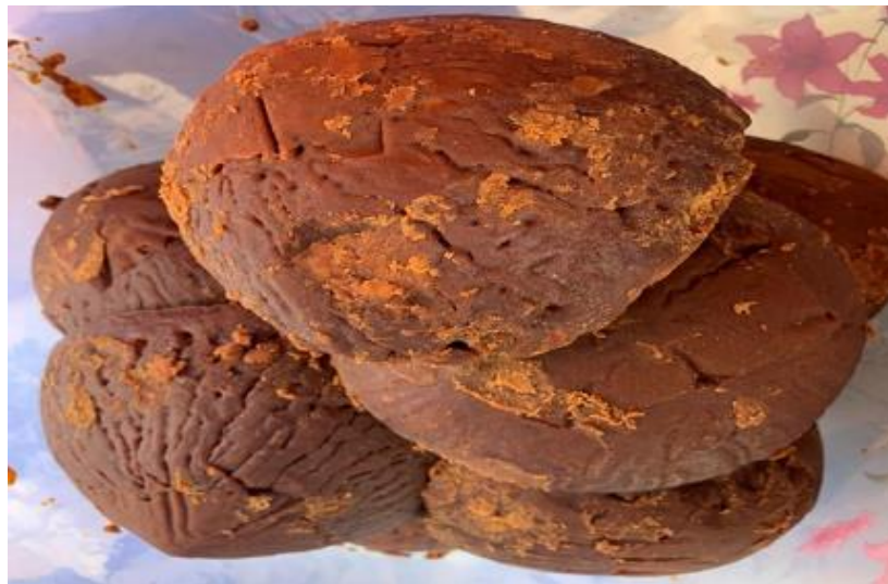
Gambar 2. Produk UMKM Yang Dijual.