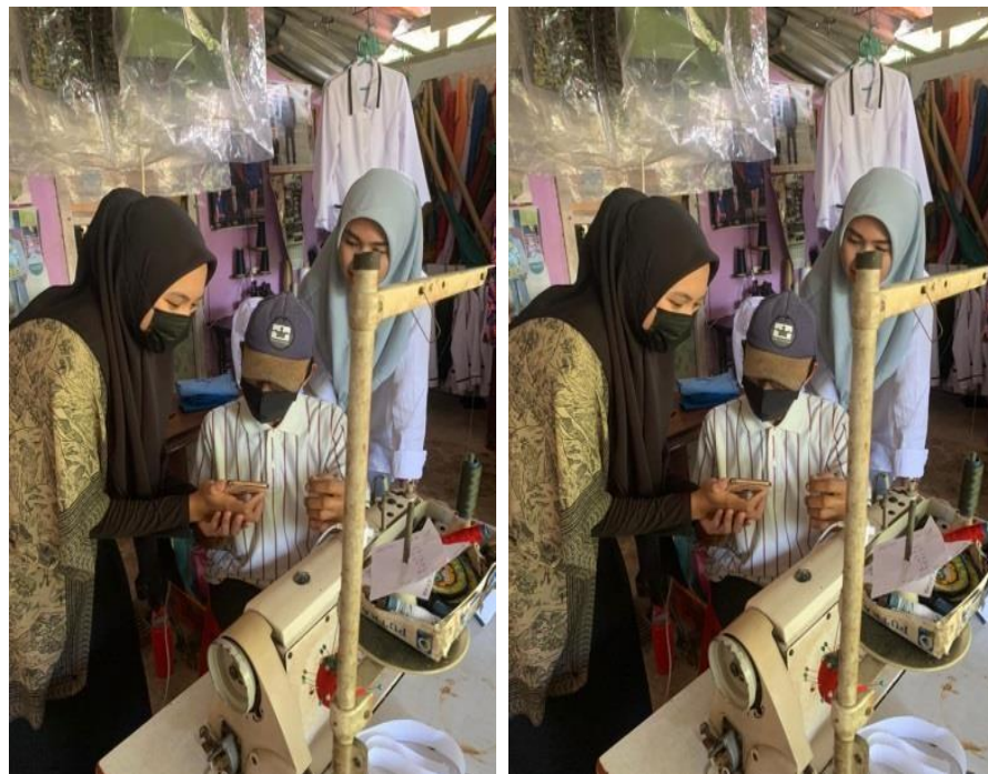
Gambar 3. Dokumentasi Pada Saat Pelatihan Menggunakan Aplikasi Buku Warung dalam Menyusun Laporan Keuangan pada Usaha Penjahit Minang Baru