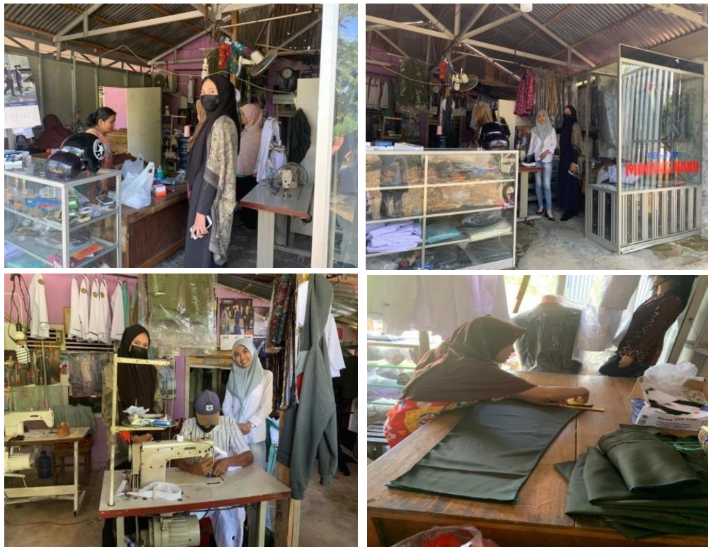
Gambar 2. Dokumentasi Bersama Pemilik Usaha Penjahit Minang Baru