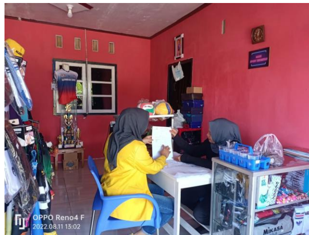
Gambar 2 : Pengenalan Pelatihan Laporan Keuangan pada Toko Peralatan Olahraga Made Sport