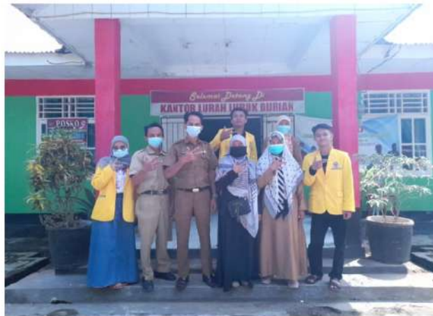
Gambar 2 setelah penyerahan video himbauan di kantor lurah Lubuk Durian

Proses pembuatan video dan penyerahan video ini dilakukan dengan pertimbangan tingginya lonjakan kasus Covid-19 di Provinsi Bengkulu. Hal tersebut disampaikan dalam rilis yang dikeluarkan oleh Satgas Covid-19 Provinsi Bengkulu pada Juni 2021. Untuk itu, Satgas menghimbau agar masyarakat Bengkulu tetap mematuhi aturan dalam protokol kesehatan (prokes), salah satunya dengan tidak berkumpul atau membuat kerumunan. Kondisi ini pada akhirnya ikut membatasi ruang gerak tim pelaksana pengabdian, baik dalam proses produksi video maupun dalam penyerahan video kepada aparat desa di Kelurahan Lubuk Durian, Kecamatan Kerkap, Kabupaten Bengkulu Utara.