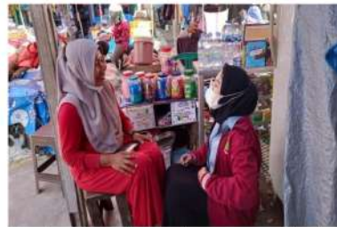
Gambar 2. Sosialisasi warga yang kedua

Tanggapan dari warga setelah diadakan nya sosialisasi manfaat pemasaran mealalui via sosial media : Responden 1 : "menurut ibu apa yang ananda sampaikan ke ibu sangat bermanfaat sekali, sehingga ini bisa menjadi pacuan ibu lebih mengembangkan usaha melalui sosial media. agar usaha ini bisa dilihat dari masyarakat luas terkhusus nya masyarakat kota Bengkulu apalagi dimasa pandemi saat ini ibu agak kesulitan untuk mendapatkan pelanggan secara langsung ,tetapi dengan adanya pemasaran melalui sosial media ibu cukup lebih efektif untuk mengembangkan atau memperkenalkan usaha ibu ke masyarakat. Terimakasih"