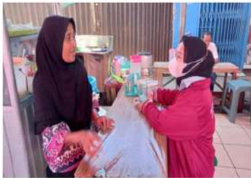
Gambar 1. Sosialisasi ke warga pertama

Dari kegiatan pengabdian ini diketahui juga bahwa kurangnya kepedulian masyarakat terhadap edukasi SDM, pemanfaatan media sosial. Jadi, melalui abdi masyarakat ini kami terjun langsung ke warga yang memiliki usaha menengah kebawah untuk memanfaatkan media sosial sebagai sarana yang tepat apalagi di musim pandemi ini sangat efektif jika dikembangkan dan di promosikan melalui media sosial sehingga lebih mudah di kenal masyarakat dalam daerah bahkan ke luar daerah. Dari pengabdian ini kami mengajarkan/mengarahkan ke masyarakat untuk membuat akun olshop dan cara mempromosikan di sosial media dengan baik dan benar agar lebih menarik dimata konsumen karena masyarakat masih ada yang belum mengerti untuk membuat akun, mempromosikan produk dimana, dan masih banyak yg belum tahu untuk mempromosikan dengan baik dan selama proker ini berjalan saya tidak ada kesu 15 untuk mengarahkan ke masyarakat. Selain itu, dalam menjalankan bisnis melalui sosial media ada beberapa hal yang harus kita perhatikan agar usaha yang kita jalankan bertahan dalam jangka panjang. Berikut disajikan beberapa dokumentasi kegiatan pengabdian ( gambar 1 dan 2)