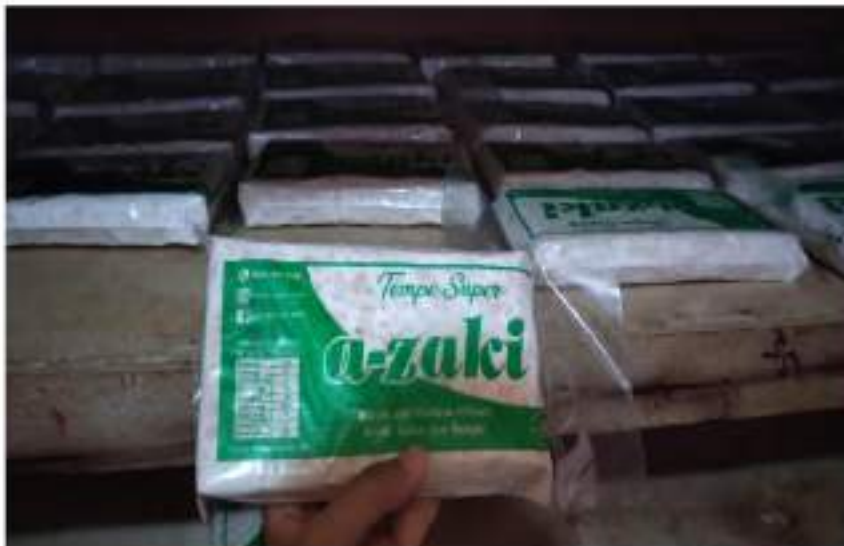
Gambar 3. Produk tempe A-Zaki