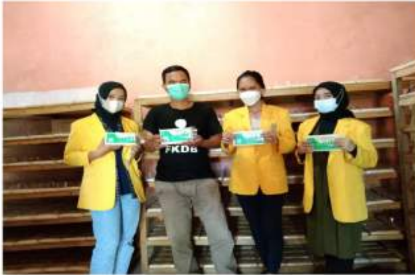
Gambar 2. Foto bersama pemilik Pabrik tempe A-Zaki

akan lebih baik lagi mengelola keuangannya dan kedepannya mampu untuk mengatur kas masuk, kas keluar, dan mampu mengelola manajemen laba dengan baik sehingga pabrik tempe A-Zaki akan terus maju dan berkembang.