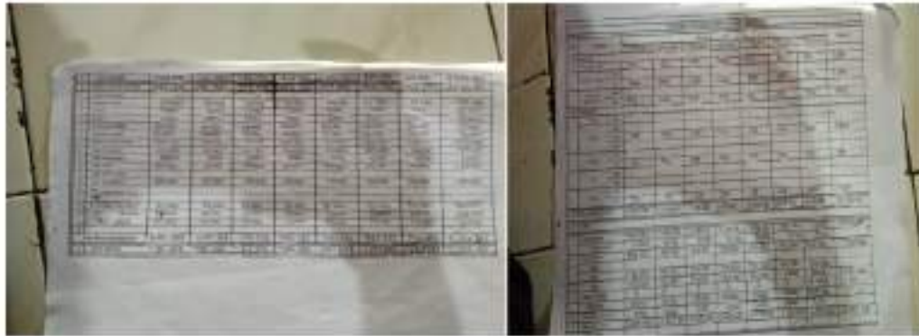
Gambar 4. Catatan transaksi penjualan tempe A-Zaki