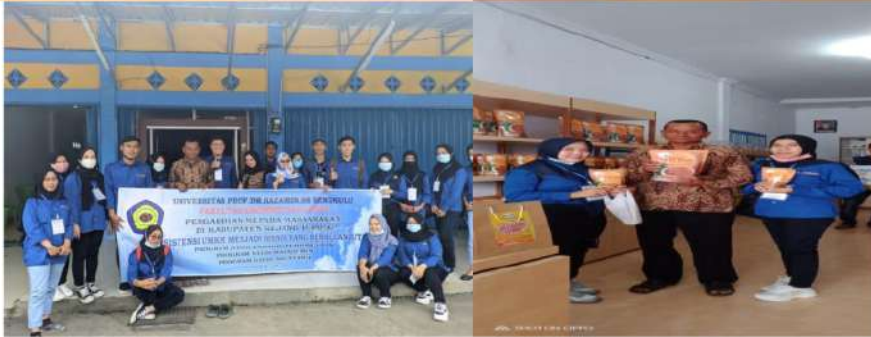
Gambar 2. Pengabdian kepada Masyarakat