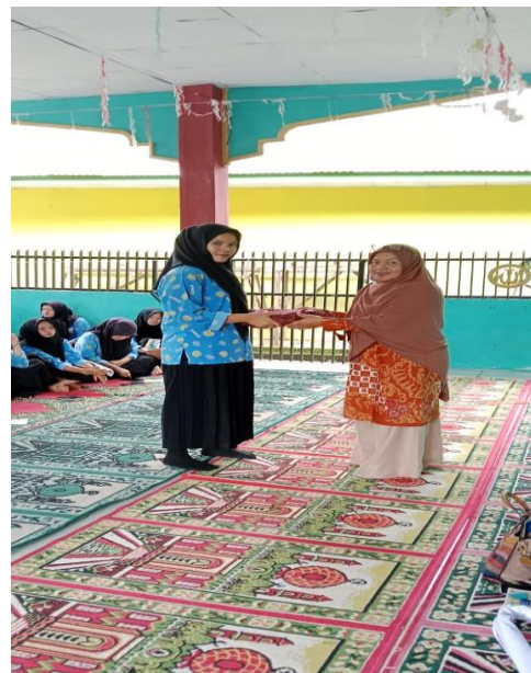
Reward untuk yang bertanya