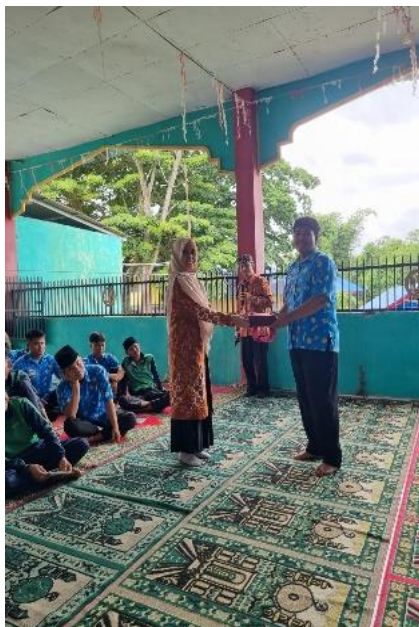
Reward untuk yang menjawab