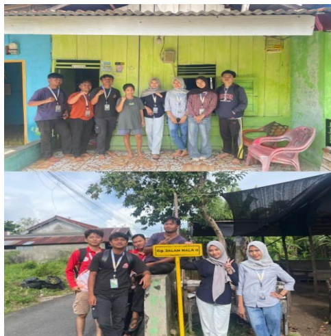
Gambar 2. Pelaksanaan Pemasangan Plang Dan Nomor Rumah

Keterlibatan warga dalam proses pemasangan menunjukkan meningkatnya rasa memiliki terhadap lingkungan. Partisipasi ini menjadi modal sosial penting untuk menjaga fasilitas yang telah dipasang agar tetap terawat.