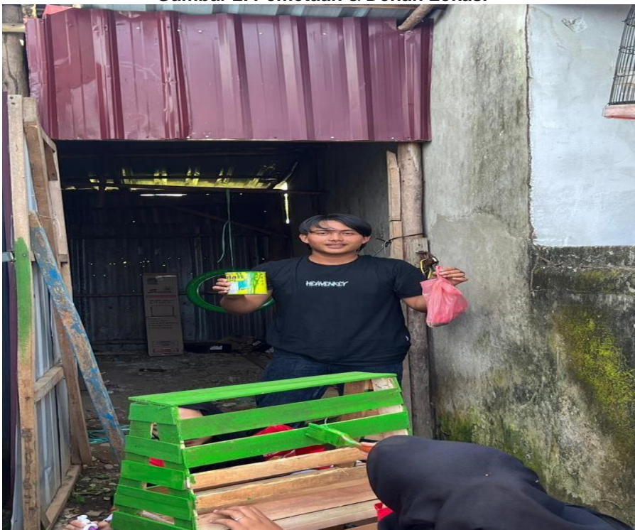
Gambar 3. Pembuatan Rak Buku