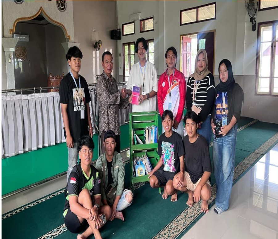
Gambar 4. Aktivasi Pojok Literasi