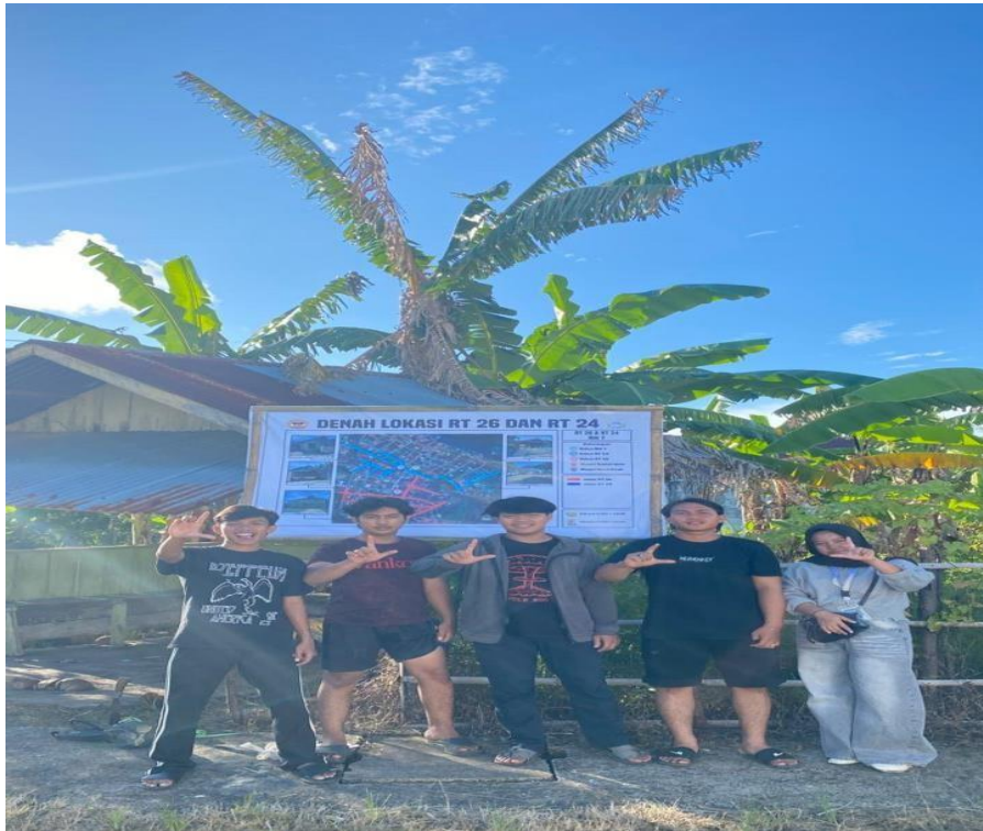
Gambar 2. Pemetaan & Denah Lokasi