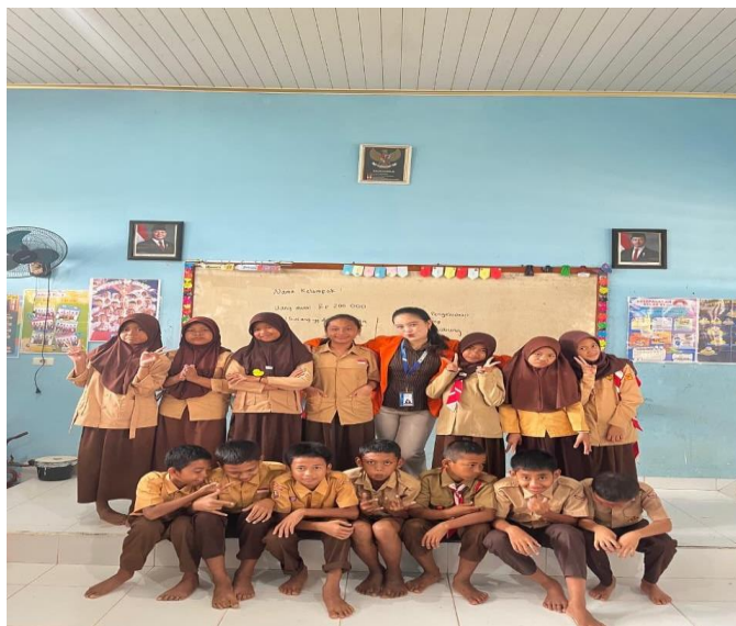
Gambar 3. Foto bersama siswa dan tim pengabdian

Foto bersama sebagai dokumentasi akhir kegiatan dan bentuk keterlibatan aktif seluruh peserta