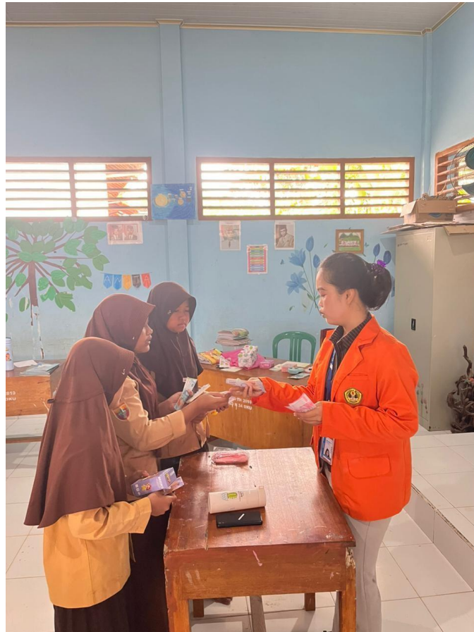
Gambar 2. Penyampaian materi literasi keuangan dasar

Permainan Cash and Coin Challenge memberikan pengalaman langsung kepada siswa dalam mengelola uang dan menentukan keputusan pembelian. Simulasi ini membantu siswa memahami konsekuensi dari setiap pilihan finansial (Yuliana, 2020; Kurniawan, 2021).