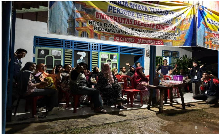
Gambar 2 Sosialisasi Tentang Literasi Digital Sosial Media Marketing Di Rt 09 Rw 02 Sawah Lebar Baru