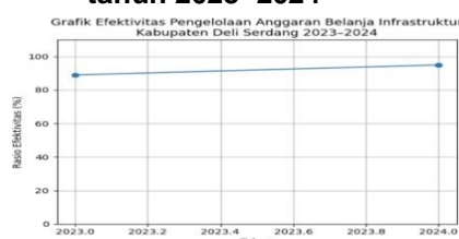
Gambar 1 Grafik efektivitas pengelolaan anggaran belanja infrastruktur Kabupaten Deli Serdang tahun 2023–2024

Berdasarkan tabel di atas, efektivitas pengelolaan anggaran belanja modal infrastruktur di Kabupaten Deli Serdang menunjukkan peningkatan dari tahun 2023 ke 2024. Pada tahun 2023, rasio efektivitas sebesar 88,98% tergolong cukup efektif, sedangkan pada tahun 2024 meningkat menjadi 94,91% dan masuk dalam kategori efektif, yang menunjukkan perbaikan dalam perencanaan dan realisasi anggaran pembangunan infrastruktur.