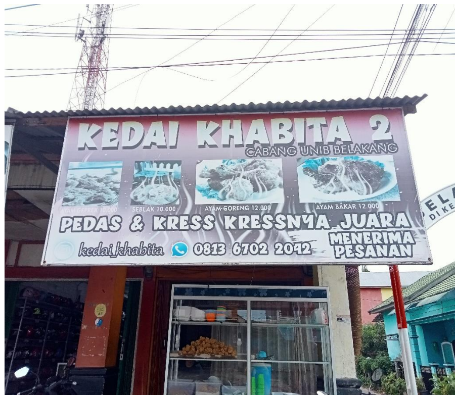
Gambar 1. Usaha Kedai Khabita

Ayam geprek adalah sajian makanan ayam goreng tepung dengan cara digeprek/ditumbuk dengan ulekan bersamaan dengan sambalnya hingga daging menjadi rata. Makanan ini sudah dikenal oleh banyak masyarakat. Ayam geprek bukan hanya sekedar menu makanan tetapi juga menjadi simbol dari kreativitas dan inovasi dalam menyajikan hidangan yang memikat lidah konsumen. Usaha ayam geprek menjanjikan keuntungan yang cukup signifikan tetapi pemilik belum memiliki laporan keuangan yang akurat sehingga pendapatan hanya bisa dihitung dengan cara sederhana. Di kedai khabita juga memperkerjakan satu kariawan yang di gaji 50 sehari.