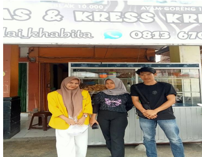
Gambar 4. Dokumentasi dengan pemilik usaha kedai khabita