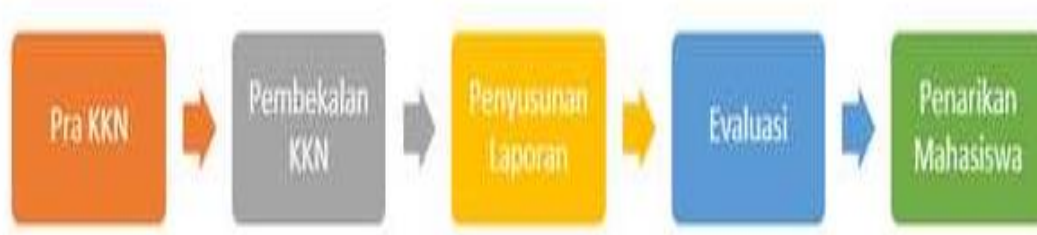
Gambar 1. Proses Program KKN

Dalam melakukan kegiatan KKN ini, sebelumnya ada langkah-langkah yang harus dilakukan terlebih dahulu. Langkah-langkah ini bertujuan agar program berjalan sesuai alur. Adapun Langkah-langkahnya bisa dilihat pada tabel dibawah.