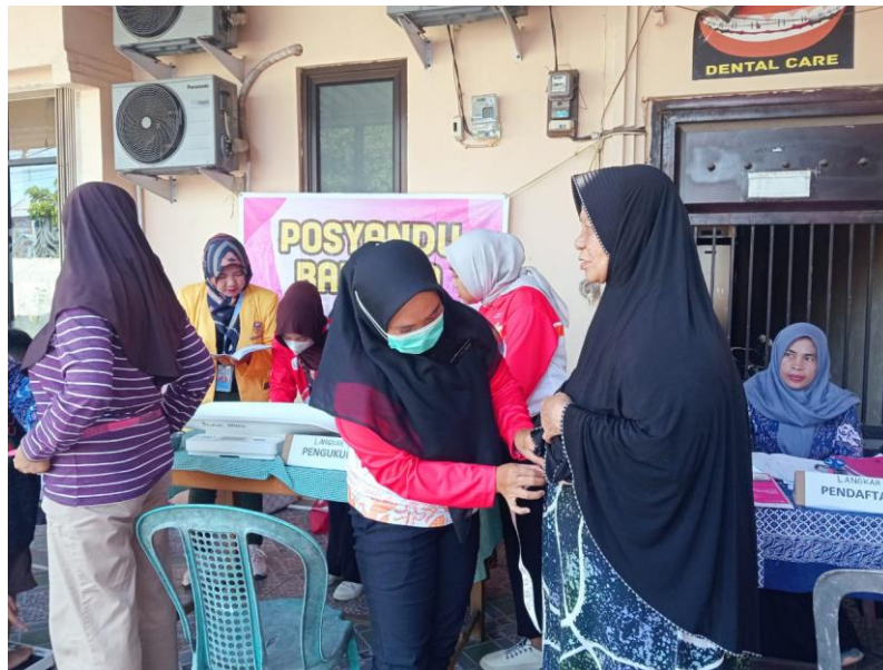
Gambar.1 Pelaksanan Posyandu

mengenai fungsi posyandu. Sebagian besar warga mengira bahwa posyandu hanya menyediakan layanan penimbangan balita, padahal posyandu mencakup rangkaian layanan kesehatan primer yang lebih luas. Kedua, muncul persepsi bahwa anak yang terlihat “sehat” tidak membutuhkan kunjungan posyandu, sehingga kunjungan dianggap tidak mendesak. Ketiga, hambatan waktu menjadi faktor dominan; jadwal posyandu sering kali bertabrakan dengan jam kerja dan aktivitas harian keluarga. Keempat, kurangnya sosialisasi menyebabkan informasi mengenai jadwal dan manfaat posyandu tidak tersampaikan secara merata.