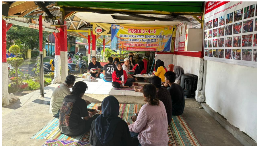
Gambar. 3 Penyuluhan Tentang Pentingnya Posyandu