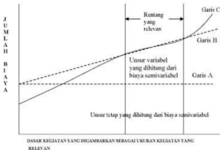
Gambar 3 : biaya semi variabel