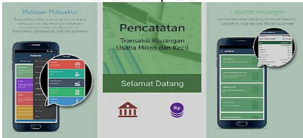
Gambar 1 Fitur Aplikasi SI APIK

Adapun fitur- fitur yang terdapat dalam aplikasi SI APIK adalah: