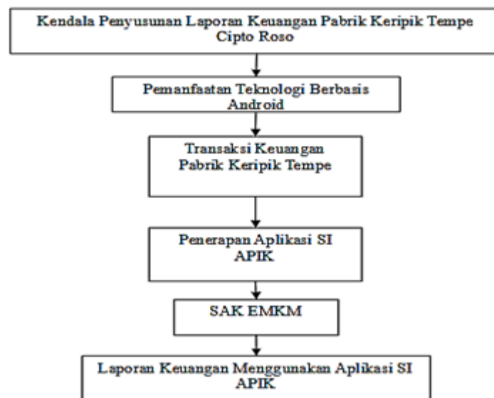
Gambar 1 Kerangka Berpikir