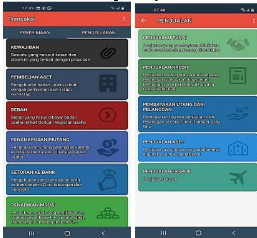
Gambar 3 Pengisian Penjualan Tunai