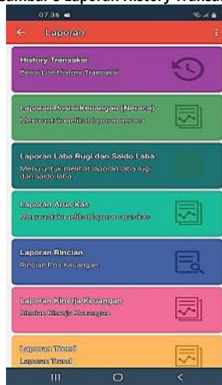
Gambar 5 Laporan History Transaksi