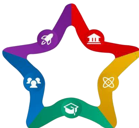
Gambar 2 Pentahelix Telkom Indonesia

Dengan terbatasnya akses dan sumberdaya perikanan dan perikanan yang kurang, terciptanya peluang yang besar yang dilihat oleh Telkom Indonesia. Telkom Indonesia mengaku bahwa dengan adanya peluang ini, Telkom Indonesia dapat mencapai tujuan mereka dalam mengembangkan digital talent yang ada di Indonesia. Langkah awal dilakukan dalam bidang perikanan dan kelautan di Indonesia.