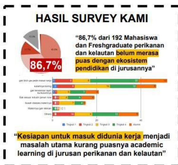
Gambar 1 Hasil survei yang ditemukan oleh Tribe Leader FCC

Selain data survei yang ditampilkan oleh Project Manager Telkom tersebut, mereka juga menyatakan bahwa Indonesia sebagai negara maritim dengan kepulauan terbesar di dunia, memiliki laut yang luas dengan kekayaan sumberdaya perikanan dan kelautan yang melimpah. Namun sangat disayangkan potensi ini belum termanfaatkan secara maksimal. Banyak mahasiswa jurusan perikanan dan kelautan yang baru lulus merasa ketidakpuasan dengan ekosistem pendidikan di jurusannya. Mereka mengaku membutuhkan informasi yang dikemas dengan menarik dan dapat menginspirasi mereka, sehingga dapat membangkitkan rasa percaya diri dan antusias untuk bisa mengolah kekayaan alam di Indonesia, khususnya dalam bidang perikanan dan kelautan. Selain itu, mahasiswa juga memiliki kesibukan yang cukup padat, sehingga mereka membutuhkan platform yang memuat informasi terkait perikanan dan kelautan, serta dapat diakses kapanpun dan dimanapun. Maka dari itu demi membantu mahasiswa perikanan dan kelautan dalam memudahkan mereka, diciptakannya wadah atau platform FCC yang dikhususkan untuk mahasiswa perikanan dalam mencari informasi dibidangnya.