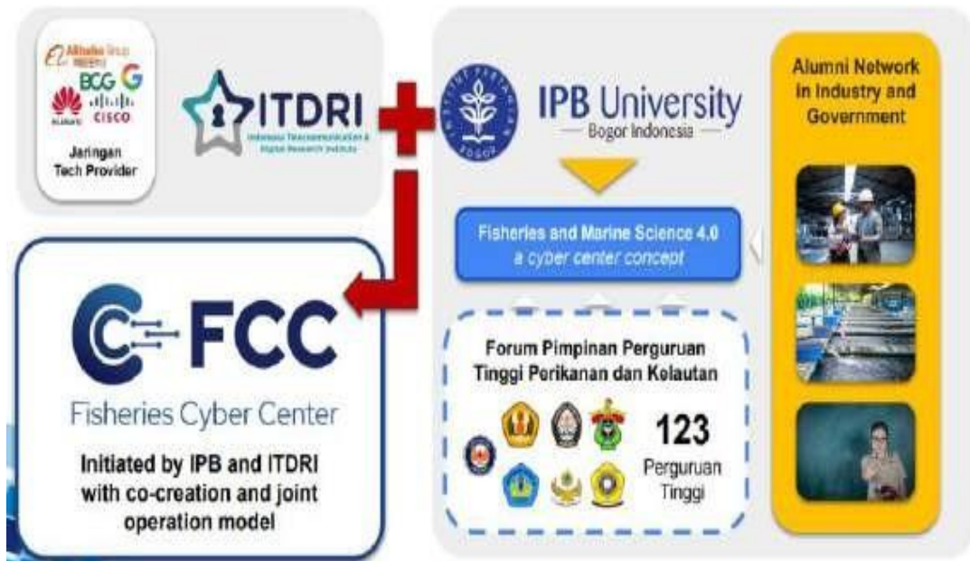
Gambar 4 Data helix akademik yang sudah bekerjasama dengan FCC

Sebagai program baru di Telkom yang sudah menjalin kerjasama sebelumnya dengan berbagai universitas yang memiliki jurusan kelautan dan perikanan merupakan nilai lebih untuk instansi pemerintah ketika memperhitungkan apa yang akan didapatkan oleh instansi pemerintah ketika bekerjasama dengan program baru Telkom ini. Ini menjelaskan dapat paragraf pertama sebagai poin untuk menarik perhatian instansi pemerintah