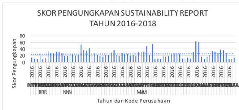
Gambar 2. Skor Pengungkapan Sustainability Report

Berdasarkan Gambar dapat dilihat bahwa secara keseluruhan skor indeks sustainability report sangat fluktuatif, dari total indeks yang harus diungkapkan perusahaan berdasarkan GRI-G4 yaitu sebanyak 91 item dan GRI- standards yaitu sebanyak 77 item, skor tertinggi yang diungkapkan perusahaan sampel hanya 64 item yang diungkapkan oleh PT Astra Agro Lestari Tbk (AALI) tahun 2016 dan skor terendah yang diungkapkan perusahaan sampel 9 item yang diungkapkan oleh PT Wijaya Karya Tbk tahun 2016 dan PT Indika Energy Tbk tahun 2016, hal ini menunjukkan perusahaan dalam melakukan sustainability activities dan mengungkapkannya belum maksimal.