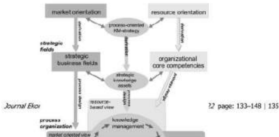
Gambar 1. Diagram Motivasi Usaha Para Pelaku Usaha Milenial

Kajian ini dibangun berdasarkan perspektif marketing knowledge management. Knowledge merupakan sumber daya yang sangat penting dalam menghadapi persaingan di lingkungan bisnis yang penuh dengan ketidakpastian. Dalam perspektif kajian ini, keterbukaan generasi milenial terhadap ekonomi digital dalam kegiatan pemasaran akan dikaji dan didekati dengan menggunakan perspektif marketing knowledge management. Keterkaitan antara keterbukaan terhadap teknologi, pemasaran, dan knowledge dapat dilihat pada gambar berikut.