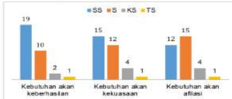
Gambar 2. Diagram Motivasi Usaha Para Pelaku Usaha Milenial

Berdasarkan temuan kajian ini terkait 3 indikator untuk aspek motivasi melakukan usaha yang dianalisis dalam kajian ini, yang meliputi kebutuhan akan keberhasilan, kebutuhan akan kekuasaan dan juga kebutuhan akan afiliasi. Untuk indikator kebutuhan akan keberhasilan, mayoritas responden dalam hal ini pelaku usaha milenial memilih salah satu alternatif jawaban yaitu sangat setuju sebanyak 19 responden, 10 responden yang memilih alternatif jawaban setuju, 2 kurang setuju, dan 1 responden yang memilih alternatif tidak setuju. Berdasarkan hal tersebut, terlihat bahwa para pelaku usaha milenial memiliki motivasi kuat dalam melakukan usaha disebabkan karena adanya kebutuhan akan keberhasilan.