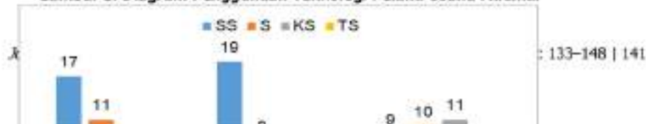
Gambar 3. Diagram Penggunaan Teknologi Pelaku Usaha Milenial

Terkait dengan penggunaan teknologi, dalam menggeluti suatu usaha atau posisi seseorang adalah pelaku usaha, maka perlu untuk mengikuti perkembangan zaman, salah satunya adalah teknologi informasi. Salah satu masalah besar terkait teknologi adalah banyaknya pelaku usaha yang memiliki keterbatasan pada kemampuan untuk memanfaatkan teknologi, padahal sebenarnya, teknologi ini memiliki banyak sekali manfaat bagi suatu usaha atau bisnis (Alfulailah & Soehari, 2020). Bahkan karena pentingnya teknologi dalam usaha, ada yang kemudian dikenal dengan kewirausahaan teknologi yang memiliki arti sebagai penggerak yang bisa memberikan fasilitas atas kemakmuran baik itu individu, perusahaan, bahkan negara (Balletti, 2012).