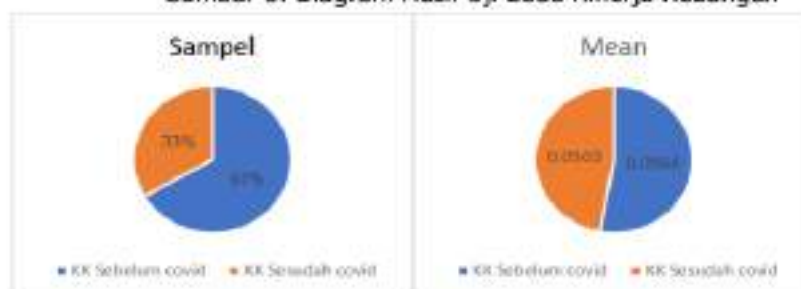
Gambar 3. Diagram Hasil Uji Beda Kinerja Keuangan

Berdasarkan gambar diagram, terlihat perbedaan KK saat sebelum covid dan selama masa covid. Dijelaskan bahwa pada saat sebelum covid, 67% dari 63 perusahaan sampel yang diteliti atau sama dengan 42 perusahaan menghasilkan mean (rata-rata) sebesar 0,0564. Sementara hasil uji beda untuk kinerja keuangan pada saat covid dengan total 33% dari total 63 perusahaan sampel yang diteliti atau sama dengan 21 sampel menghasilkan nilai mean 0,0503. Dapat disimpulkan bahwa terdapat perbedaan dari kedua kelompok. Rata-rata KK sebelum covid lebih besar dibandingkan KK pada saat covid.