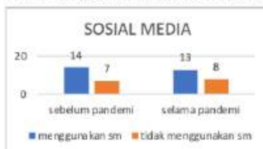
Gambar 2. Diagram Penggunaan Sosial Media