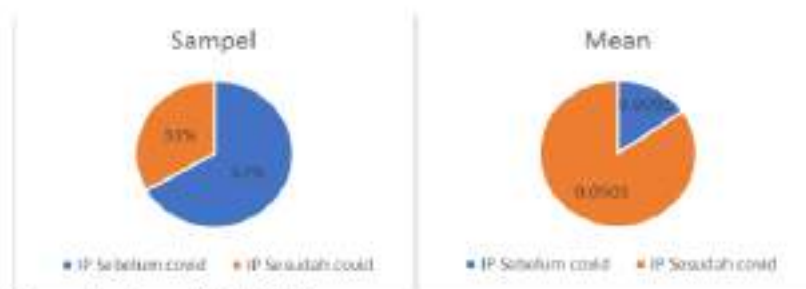
Gambar 1. Diagram Hasil Uji Beda Inovasi Produk