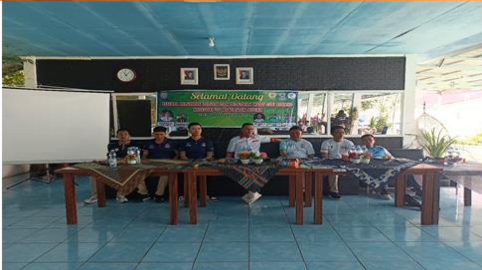
Gambar 4 Diskusi Tamu Undangan dan Team Dosen Pengabdian