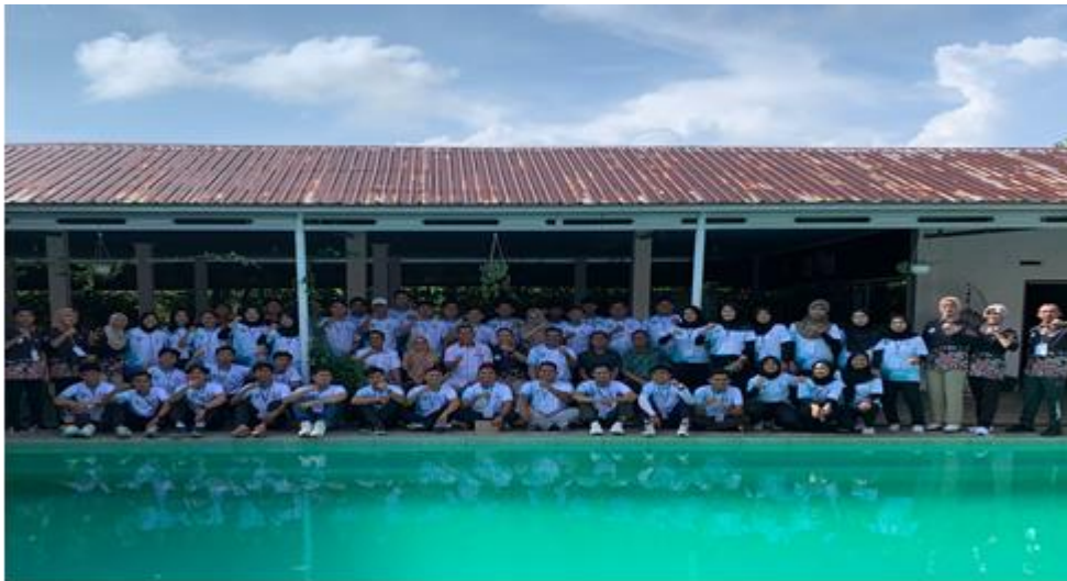
Gambar 5 Foto Bersama Peserta Pelatihan Pelatih dan Wasit Juri Kategori "D" di Kabupaten Seluma