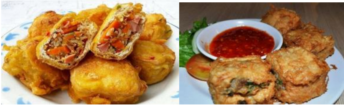
Gambar 4. Tahu Jeletot Isi Sayur