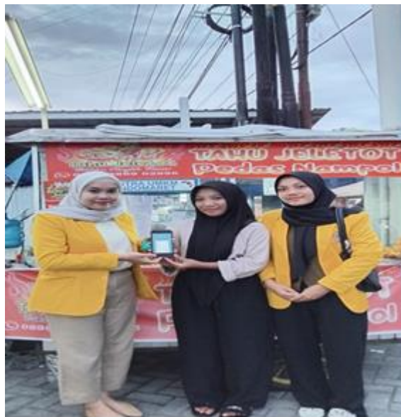
Gambar 2. Pengenalan Aplikasi Kepada Pengusaha UMKM

Dengan melakukan pencatatan transaksi keuangan pada UMKM adalah menghasilkan laporan keuangan sesuai dengan Standar Akuntansi Keuangan Entitas Mikro, Kecil dan Menengah (SAK EMKM). Dalam aplikasi Akuntansiku, laporan keuangan yang dihasilkan sangat lengkap meliputi laporan posisi keuangan (neraca), laporan laba rugi, laporan arus kas, dan laporan perubahan modal. Pelaku UMKM tidak perlu menghitung dan menyusun laporan keuangan secara manual karena sudah secara otomatis menghasilkan berbagai macam laporan keuangan yang terakumulasi selama periode tertentu. Dengan demikian, pelaku UMKM hanya perlu mengklik menu laporan untuk melihat hasil laporan keuangan usahanya.