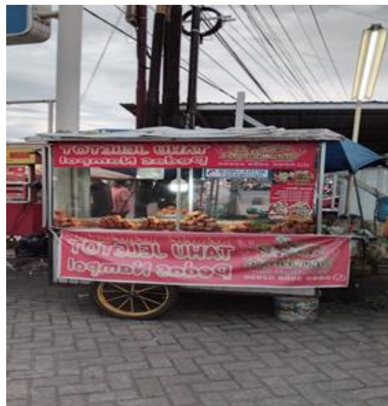
Gambar 3. Gerobak Pengusaha UMKM