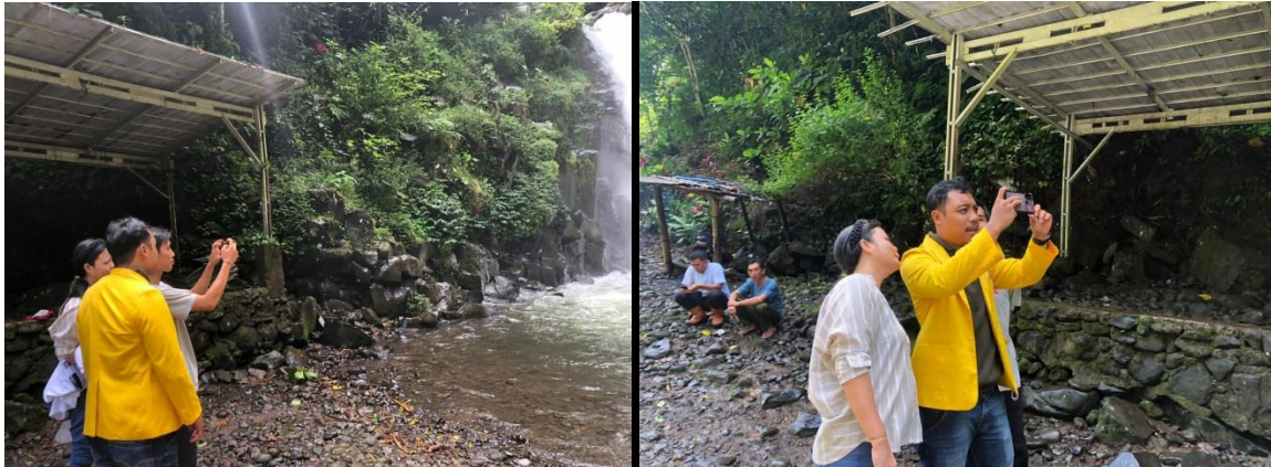
Gambar 2. Proses Pendampingan Pengambilan Gambar

darat dan udara untuk menghasilkan video profil wisata alam desa sehingga dapat menghasilkan video yang berkualitas (Arifin, 2023).