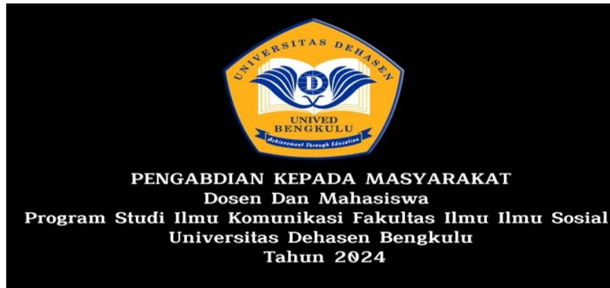
Gambar 3. Cuplikan Video

Hasil kegiatan pengabdian masyarakat berupa video ini akan dipublikasikan kepada masyarakat luas melalui berbagai platform media sosial tim pengabdian masyarakat, perangkat desa, karang taruna dan masyarakat desa. Video ini dapat dilihat di link Youtube https://youtu.be/RF4C2wGUVi4?si=d6Kwphitjrk8z et.