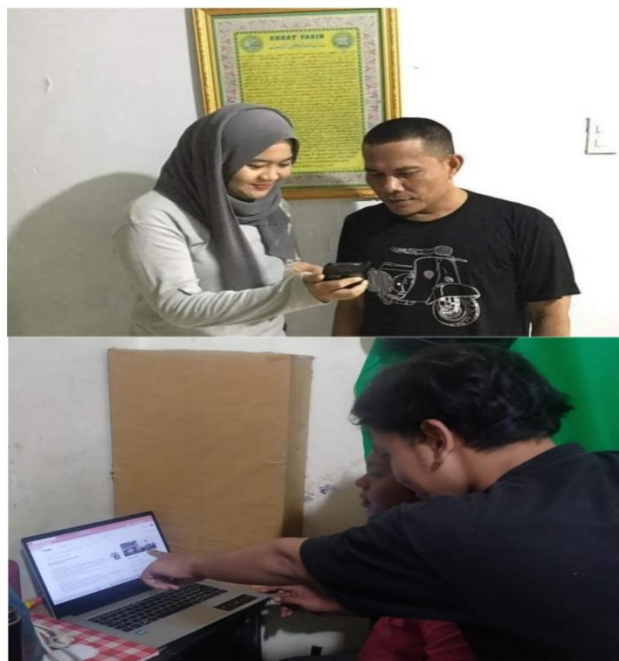
Gambar 2. Penerapan aplikasi evermos kepada masyarakat