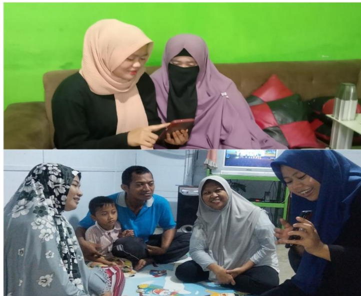
Gambar 1. Dokumentasi sosialisasi mengenai aplikasi evermos