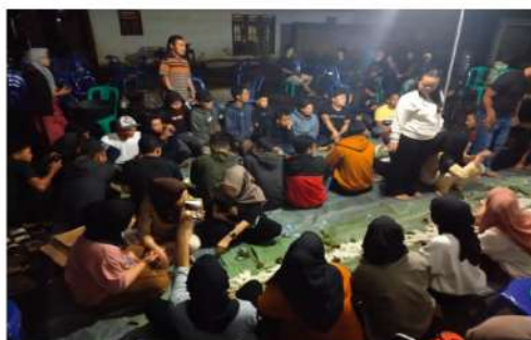
Gambar 5. Sarasehan dengan Masyarakat