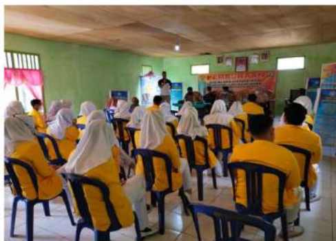
Gambar 4. Pelaksanaan Pembekalan