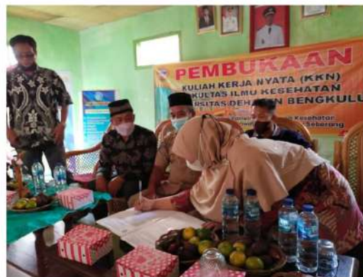
Gambar 3. Penanda-tanganan BAP Penyerahan