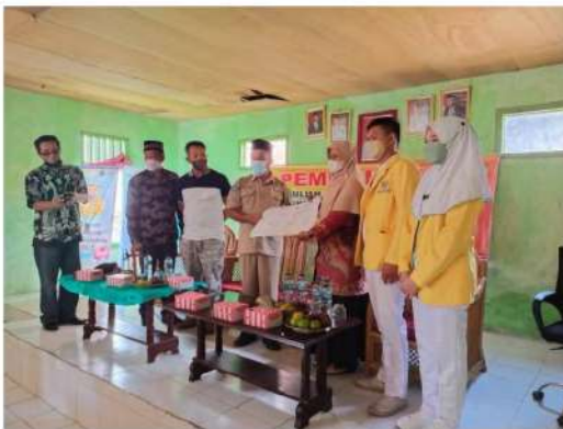
Gambar 2. Penyerahan Mahasiswa oleh WR IV Disaksikan oleh Unsur Pemda setempat dan Ka. LPPM Univ. Dehasen Bengkulu