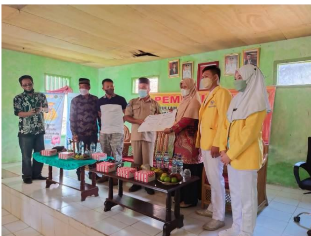
Gambar 2. Penyerahan Mahasiswa oleh WR IV Disaksikan oleh Unsur Pemda setempat dan Ka. LPPM Univ. Dehasen Bengkulu