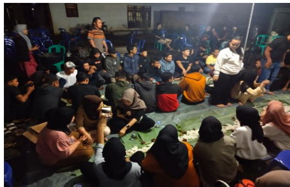
Gambar 5. Sarasehan dengan Masyarakat