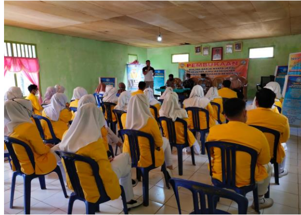
Gambar 4. Pelaksanaan Pembekalan