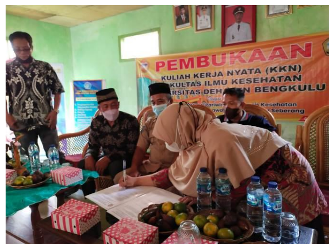
Gambar 3. Penanda-tanganan BAP Penyerahan