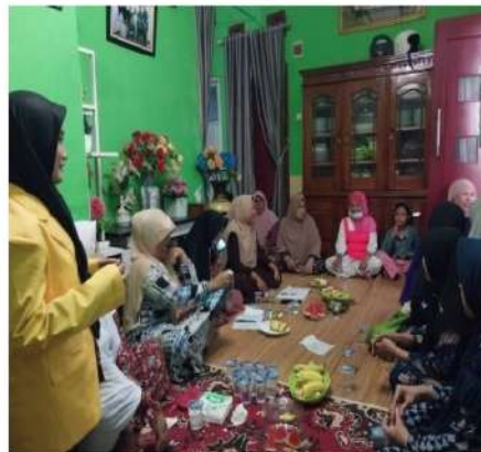
Gambar 3. Sosialisasi kepada Ibu-ibu RT 10 RW 04 mengenai Digital Marketing.