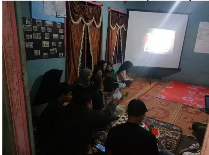
Gambar 2. Pendidikan Kesehatan pada Remaja

Manfaat dari pendidikan kesehatan ini antara lain adalah untuk memperoleh pengetahuan, pemahaman dan manfaat pentingnya tentang Pernikahan dini penyebab stunting. Tujuan pendidikan kesehatan ini adalah mengubah perilaku remaja tentang pernikahan dini penyebab stunting. Materi yang ditanyakan seputar tentang pernikahan dini penyebab dini.