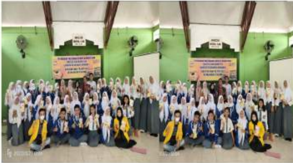
Gambar 6. Foto Bersama Dengan Siswa Usai Kegiatan