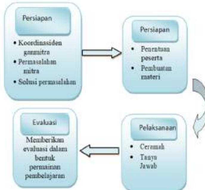
Gambar 1. Diagram Alir Kegiatan Pengabdian Kepada Masyarakat

Metode pelaksanaan pengabdian kepada masyarakat yang dilakukan di Sekolah Menengah Atas Negeri 3 Selama mengikuti aluran seperti dijelaskan pada gambar 1 berikut :