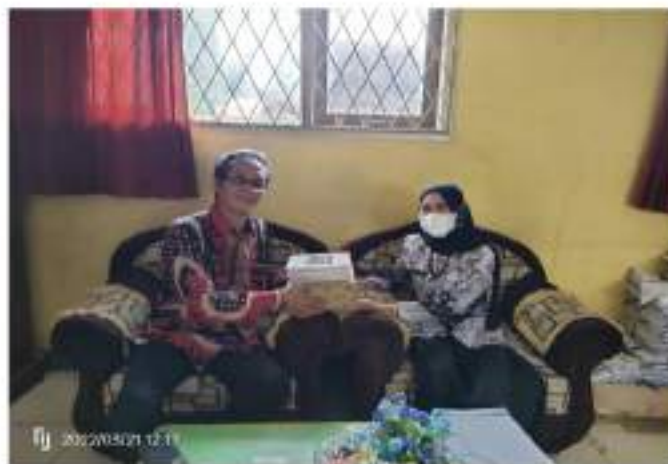
Gambar 5. Penyerahan Cenderamata dari Universitas Dehasen Bengkulu