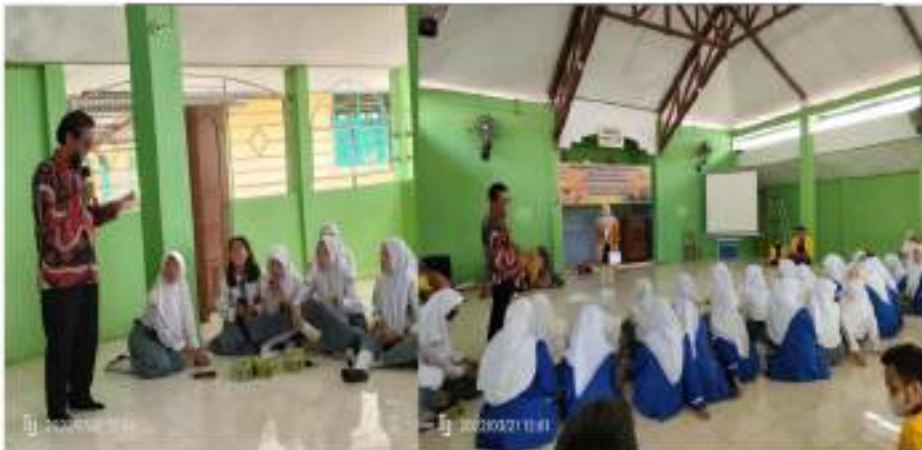
Gambar 3. Pemberian Materi di Sekolah Menengah Atas 3 Selama