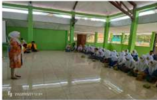
Gambar 4. Presentasi Materi