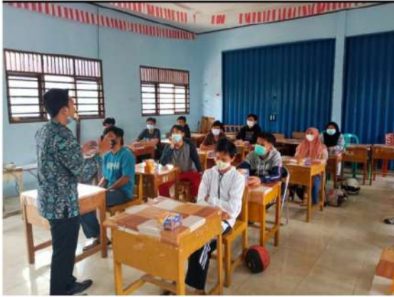
Gambar 4. Pemateri meyampaikan materi tentang program latihan