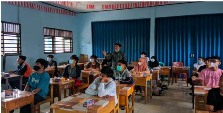
Gambar 2. Pemateri saat menyampaikan materi