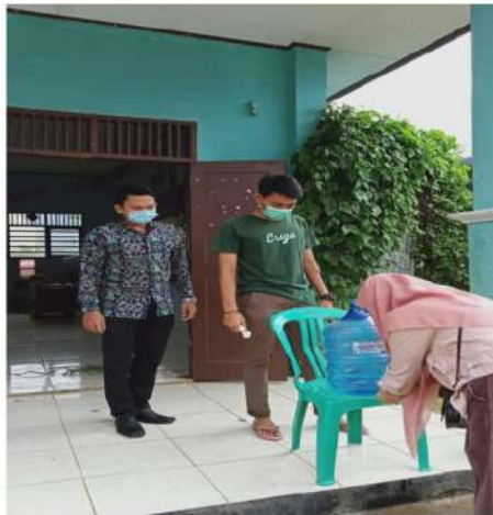
Gambar 5. Peserta pelatihan mencuci tangan terlebih dahulu