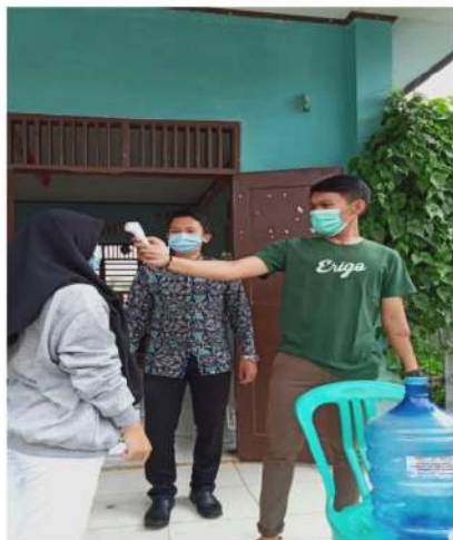
Gambar 6. Peserta pelatihan diukur suhunya sebelum masuk ke ruangan