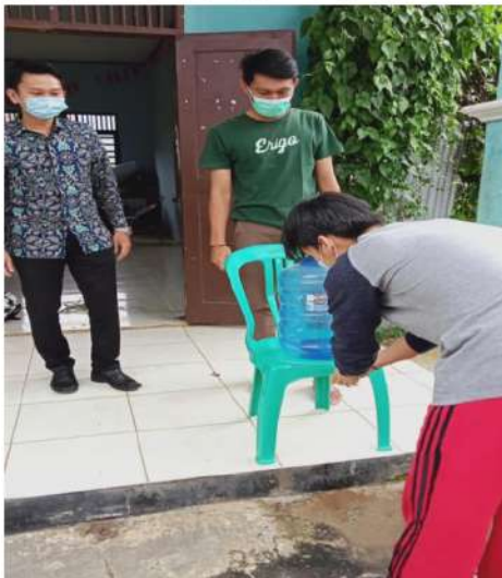
Gambar 3. Peserta pelatihan mencuci tangan terlebih dahulu