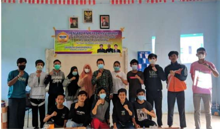
Gambar 1. Foto bersama atlet-atlet muda bolabasket Kabupaten Kepahang