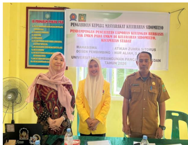
Gambar 4. Foto Bersama Kepala Kelurahan Sidomulyo

Setelah kegiatan pelatihan, evaluasi akhir dilakukan melalui penyebaran kuesioner post-test dengan 14 pertanyaan yang menggunakan skala Likert dengan pilihan Sangat Setuju, Setuju, Netral, Tidak Setuju, dan Sangat Tidak Setuju untuk mengukur peningkatan pemahaman peserta. Hasil post-test menunjukkan peningkatan yang sangat signifikan dimana mayoritas peserta menjawab Sangat Setuju dan Setuju pada pertanyaan bahwa mereka memahami konsep dasar SAK EMKM, mampu membedakan omzet dengan laba bersih, memahami pentingnya memisahkan keuangan pribadi dan usaha, serta mampu menyusun laporan keuangan sederhana. Mayoritas peserta juga menjawab Setuju bahwa materi mudah dipahami, metode pelatihan sangat efektif, dan menyatakan komitmen untuk mulai menerapkan pencatatan keuangan secara rutin dalam pengelolaan usaha mereka. Kegiatan ditutup dengan foto Bersama. Seluruh peserta hadir dari awal hingga akhir dengan antusiasme tinggi, menunjukkan keberhasilan kegiatan dalam meningkatkan pemahaman UMKM terhadap pencatatan keuangan berbasis SAK EMKM.