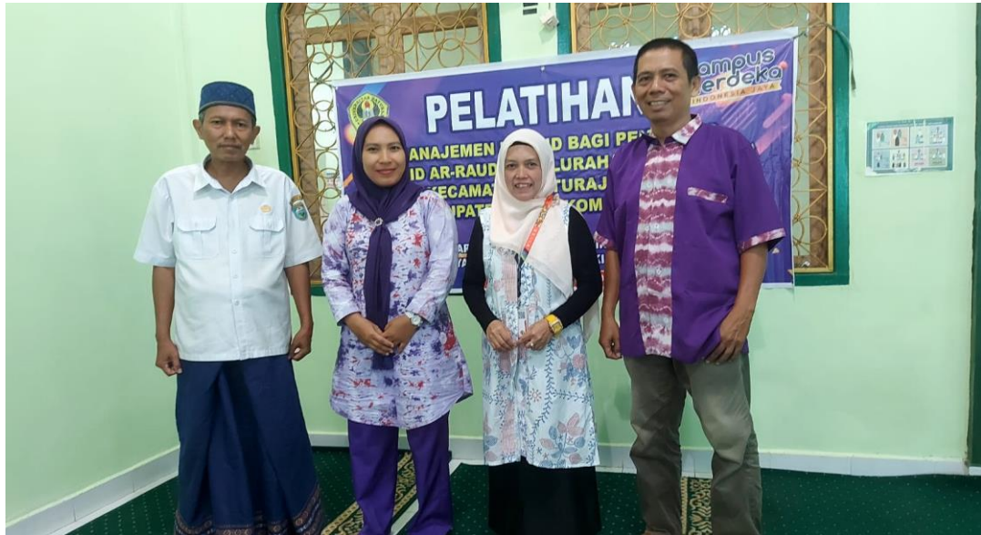
Gambar 2 Proses kegiatan pengabdian kepada Masyarakat di masjid Ar-Raudho

Hasil diskusi dengan peserta pelatihan mengungkapkan bahwa masih ada banyak tantangan dan hambatan yang dihadapi oleh pengurus dalam upaya pengembangan masjid, kurang optimalnya fungsi struktur organisasi, yang mengakibatkan manajemen organisasi masjid menjadi kurang efektif. Padahal, organisasi masjid yang efisien harus memiliki sistem yang teratur dan disiplin untuk mencapai tujuan jamaah. Dengan berfungsinya struktur organisasi masjid, posisi dan tugas setiap anggota menjadi lebih jelas, dan hasilnya, tanggung jawab individu menjadi terdefiniskan dengan baik serta jalur koordinasi dalam organisasi menjadi lebih teratur dan tertib. Dalam manajemen masjid, pengurus harus memanfaatkan fasilitas yang tersedia di masjid untuk menjalankan program kerja yang telah ditetapkan dalam rapat tahunan. Hal ini akan mempermudah pelaksanaan kegiatan dan menghemat biaya. Selain itu, sikap tanggung jawab dan penerapan tugas masing-masing pengurus menjadi kunci penting dalam mendukung manajemen masjid yang efektif. Setiap pengurus harus menjalankan fungsinya sesuai dengan tugas, wewenang, dan tanggung jawabnya. Pada tahap pelaksanaan, kepemimpinan juga diperlukan untuk memastikan kegiatan berjalan sesuai dengan rencana yang telah disepakati dalam rapat kerja.