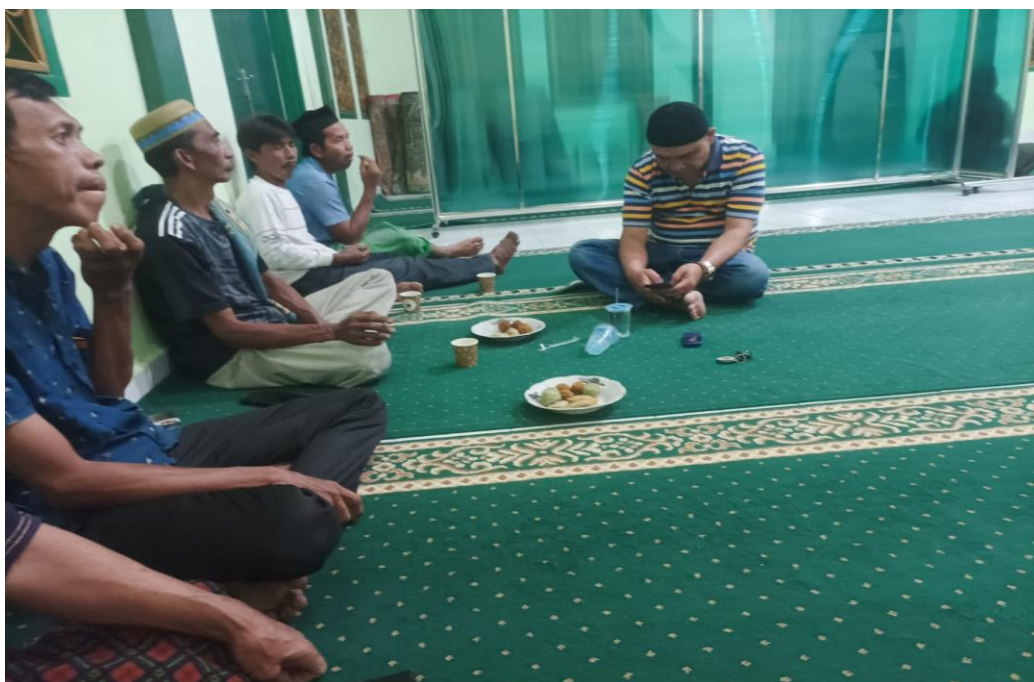
Gambar 3. Kegiatan sosialisasi

Hasil diskusi dengan peserta pelatihan mengungkapkan bahwa masih ada banyak tantangan dan hambatan yang dihadapi oleh pengurus dalam upaya pengembangan masjid, kurang optimalnya fungsi struktur organisasi, yang mengakibatkan manajemen organisasi masjid menjadi kurang efektif. Padahal, organisasi masjid yang efisien harus memiliki sistem yang teratur dan disiplin untuk mencapai tujuan jamaah. Dengan berfungsinya struktur organisasi masjid, posisi dan tugas setiap anggota menjadi lebih jelas, dan hasilnya, tanggung jawab individu menjadi terdefiniskan dengan baik serta jalur koordinasi dalam organisasi menjadi lebih teratur dan tertib. Dalam manajemen masjid, pengurus harus memanfaatkan fasilitas yang tersedia di masjid untuk menjalankan program kerja yang telah ditetapkan dalam rapat tahunan. Hal ini akan mempermudah pelaksanaan kegiatan dan menghemat biaya. Selain itu, sikap tanggung jawab dan penerapan tugas masing-masing pengurus menjadi kunci penting dalam mendukung manajemen masjid yang efektif. Setiap pengurus harus menjalankan fungsinya sesuai dengan tugas, wewenang, dan tanggung jawabnya. Pada tahap pelaksanaan, kepemimpinan juga diperlukan untuk memastikan kegiatan berjalan sesuai dengan rencana yang telah disepakati dalam rapat kerja.