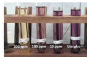
Gambar 2. Hasil Analisis Kualitatif Analisis Aktivitas Antioksidan Daun Sungkai dengan pelarut Metanol (kiri) dan Aquadest (Kanan)

Adanya perubahan warna juga membuktikan bahwa ekstrak yang diuji memiliki aktivitas antioksidan (Krisnawan,