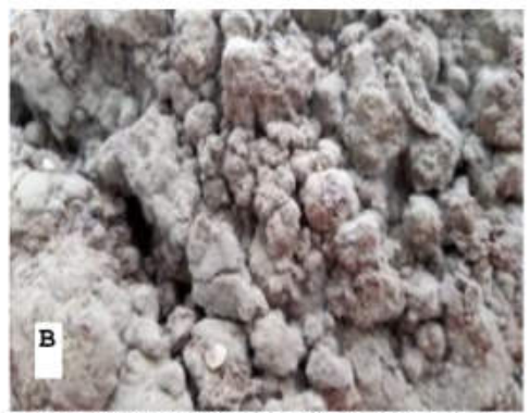
Gambar 1.Limbah SBE sebelum diperlakukan secara bioproses fermentasi menggunakan bioaktivator (A) dan setelah difermentasi (B) selama 21 hari pada kondisi tertutup, menunjukkan perubahan tampilan yang sangat berbeda. Beberapa jenis mikroba tumbuh subur menutupi hamper keseluruhan permukaan butiran SBE.