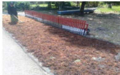
Gambar 3. Proses Pengeringan Rumput Laut

kering. Namun umumnya petani menjual dalam bentuk kering. Proses pengeringan terlihat pada gambar 3