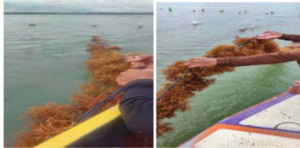
Gambar 2. Proses Pemanenan

Rumput laut yang ada pada tali kemudian dilepas. Kerang-kerang kecil yang melekat pada tali dan pelampung ikut dibersihkan. Rata-rata petani budidaya rumput laut melakukan pemanenan 3x dalam setahun.